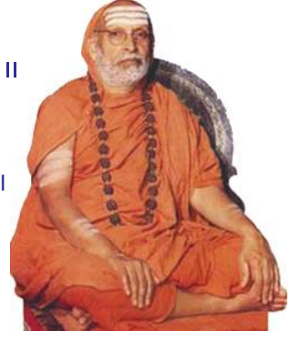
జగద్గురు శ్రీమదభినవ విద్యాతీర్థ మహాస్వామినః