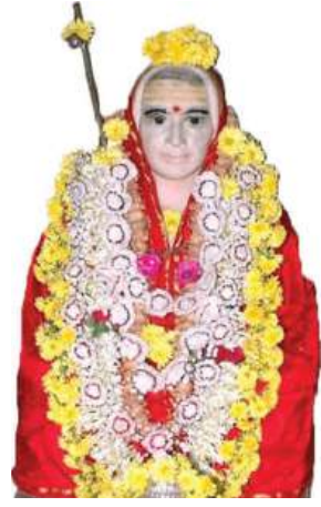
జగద్గురు శ్రీ సురేశ్వరాచార్యః