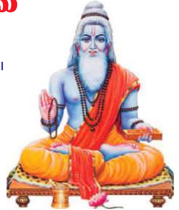
భగవాన్ శ్రీ వేదవ్యాస మహర్షిః

శ్లో॥ శుద్ధస్ఫటిక సంకాశం శుద్ధ విద్యా ప్రదాయకం । శుద్ధం పూర్ణం చిదానందం సదాశివమహం శ్రయే ॥ శ్లో॥ సీమాతీతమనాద్యంతం నామోచ్చారణ భేషజం । కామితాశేషఫలదం శ్రీమద్విష్ణుమహం శ్రయే ॥ శ్లో॥ యోగిహృత్పద్మనిలయం నత జీవ హితే రతం । శ్రుతీనాం జన్మభూమిం తం చతుర్ముఖమహం శ్రయే ॥ శ్లో॥ ప్రసమాహితమత్యంతం ప్రథిమామిత తేజసం । వశీకృతపరానందం వసిష్ఠం గురుమాశ్రయే ॥ శ్లో॥ శుక్తౌ రూప్యమివాభాతి యద్రూపం మయి కల్పితం । శక్త్యా పరిహృతం యేన శక్తిం తం గురుమాశ్రయే ॥ శ్లో॥ కరణాతీతచిద్రూపం పరిపూర్ణం పరాయణం । పరమానందసంతుష్టం పరాశరమహం శ్రయే ॥ శ్లో॥ వేదవ్యాసం స్వాత్మరూపం సత్యసంధం పరాయణం । శాంతం జితేంద్రియక్రోధం సశిష్యం ప్రణమామ్యహమ్ ॥ శ్లో॥ త్రికాలాతీతచిన్మాత్ర ప్రశాంతస్వాంతసంయుతం । వికారాద్యైరసంస్పృష్టం శుకం గురుమహం శ్రయే ॥ శ్లో॥ గూఢా మాయా యస్య వాక్యైర్వీడితా విలయం గతా । క్రీడంతం విద్యయా సార్థం గౌడపాదం తమాశ్రయే ॥ శ్లో॥ జీవేశభేదరహితం నావికం భవవారిధేః । భావాభావ విదూరస్థం గోవిందం గురుమాశ్రయే ॥