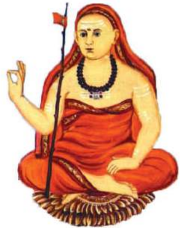
జగద్గురు శ్రీ విద్యారణ్య మహస్వామినః