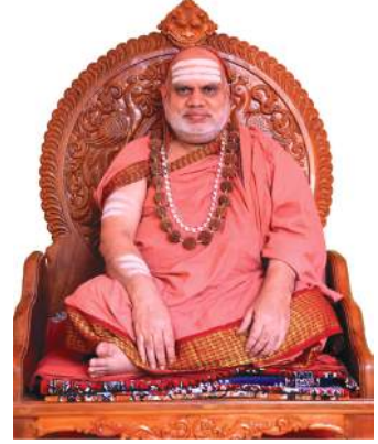
జగద్గురు శ్రీ భారతీతీర్థ మహాస్వామినః