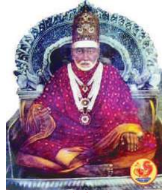
జగద్గురు శ్రీ నృసింహ భారతీ మహాస్వామినః

శ్లో॥ కింకరీకృత భూపాలం పంకేరుహ సమాననం । తం కారుణ్యపయోరాశిం శంకరాఖ్యం గురుం శ్రయే ॥ శ్లో॥ చంద్రికాధవళోదార సాంద్రకీర్తిచ్ఛటాధరం । ఇంద్రియైర్ద్వర్జయం నౌమి చంద్రశేఖర భారతీమ్ ॥ శ్లో॥ ప్రసిద్ధ విద్యానిలయమసమాన గుణోత్కటం । బిసజ్జాక్షార్పకం భక్త్యా నృసింహం తీర్థమాశ్రయే ॥ శ్లో॥ పురుహూతాది దేవేషు పౌరుషేయ గుణోత్కటం । పురుషార్థప్రదం నౌమి పురుషోత్తమ యోగినమ్ ॥ శ్లో॥ కామద్విరద పంచాస్యరామణీయక మందిరం । సోమోపమాననం శ్రీమద్రామచంద్ర గురుం భజే ॥ శ్లో॥ సురసింధు లసత్కీర్తిం స్మరసింధుఘటోద్భవం । నారసింహార్చకం శ్రీమన్నారసింహ యతిం భజే ॥ శ్లో॥ సారాఽసార వివేకజ్ఞం మారకాననకుంజరం । శూరం దానే చ నిరతం నారసింహయతిం భజే ॥ శ్లో॥ నృసింహతాం ప్రయాంత్యాశు యమాశ్రిత్య జనా భువి । తం నృసింహగురుం వందే ద్విగుణోపపదం సదా ॥ శ్లో॥ తం సర్వభూతాభయదం విభవైరన్వితం పరం । నారసింహం గురుం చాపి నవం జ్ఞానార్ణవం భజే ॥ శ్లో॥ సత్యస్వరూపం సజ్జ్ఞాన నిష్ఠం సాక్షాచ్ఛివం పరం । సదా దానరతం దాంతం సచ్చిదానందమాశ్రయే ॥ శ్లో॥ మహామేరు సమం ధైర్యే మాధుర్యేఽప్యమృతోపమం । ఊహాపోహార్థ నిష్ఠాతం నారసింహ గురుం భజే ॥ శ్లో॥ సచ్చిత్తాంబుజ మిత్రాయ సచ్చరిత్రయుజే నమః । సచ్చిదానంద భారత్యై సచ్చిదానంద మూర్తయే ॥ శ్లో॥ సచ్చిదానంద భారత్యై నవ్యాయాస్తు నమోఽనిశం । భవ్యాత్మ జ్ఞాన నిర్ఘాతావిద్యా కార్యోపలబ్ధయే ॥ శ్లో॥ మార మాతంగ పంచాస్యం మదసర్ప ద్విజర్షభం । నృసింహ భారతీం వందే జితాక్ష తురగం సదా ॥ శ్లో॥ తత్త్వమస్యాది వేదాంత వాక్యార్థ జ్ఞాన వారిధేః । పూర్ణ చంద్రమసం వందే సచ్చిదానంద యోగినమ్ ॥ శ్లో॥ అభినవ పద పూర్వాన్ సచ్చిదానంద సంజ్ఞాన్ నిగమ శిఖర వేద్యాన్ నిత్య కళ్యాణ రూపాన్ । త్రిభువన జన వంద్యాన్ సర్వ లోకైక హృద్యాన్ హృదయ కమల మధ్యే భావయామ్యంబుజాఽస్యాన్ ॥