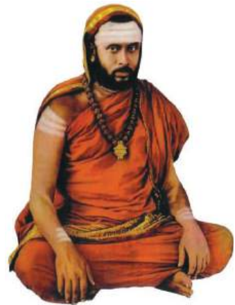
జగద్గురు శ్రీ చంద్రశేఖర భారతీ మహాస్వామినః