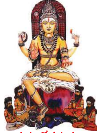
సర్వలోకగురుః శ్రీ మేధాదక్షిణామూర్తిః

శ్లో॥ శుక్లాంబరధరం విష్ణుం శశివర్ణం చతుర్భుజం । ప్రసన్నవదనం ధ్యాయేత్ సర్వవిఘ్నోపశాంతయే ॥ శ్లో॥ గురవే సర్వలోకానాం బిషజే భవరోగిణాం । నిధయే సర్వవిద్యానాం దక్షిణామూర్తయే నమః ॥ శ్లో॥ గురుర్బ్రహ్మ గురుర్విష్ణుః గురుర్దేవో మహేశ్వరః । గురుస్సాక్షాత్పరం బ్రహ్మ తస్మై శ్రీగురవే నమః ॥ శ్లో॥ జ్ఞానానందమయం దేవం నిర్మలస్ఫటికాకృతిం । ఆధారం సర్వ విద్యానాం హయగ్రీవముపాస్మహే ॥ శ్లో॥ సదాశివసమారంభాం శంకరాచార్యమధ్యమాం । అస్మదాచార్యపర్యంతాం వందే గురు పరంపరామ్ ॥