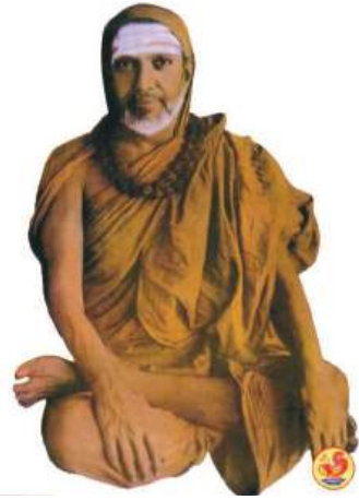
జగద్గురు శ్రీ సచ్చిదానంద శివాభినవ నృసింహ భారతీ మహాస్వామినః